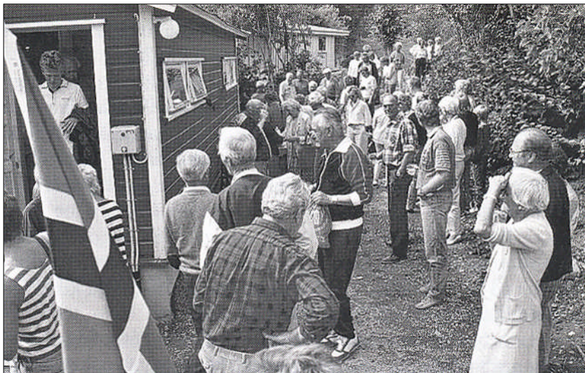
Åpningen av Brusedoen i 1989