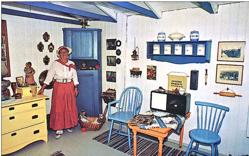
Elsie Nævestad på Museet

Åtte driftige damer satte igang arbeidet med å rive ned de gamle dobenkene, vaske og snekre. Dette arbeidet pågikk de to påfølgende somrene. Den 8. august 1993 kunne museumsgruppa invitere til åpning av et trivelig og velutstyrt lite museum, hvor det også var avsatt plass til en av doene med benk og bømte! På åpningsdagen ble museet besøkt av ca. 70 kolonister.