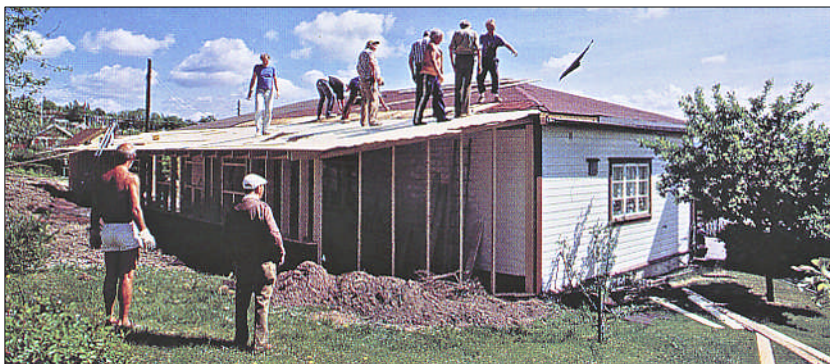
Utbygging av Huset i 1990

På ekstraordinær generalforsamling 19. mai 1989 bestemte vi at det skulle legges frostfritt vann og avløp opp til Huset. På vårmøtet den 6. mai 1990 ble det vedtatt å bygge sanitæranlegg på Huset. Styret hadde utredet kostnader og plassering av et nytt sanitærbygg i skråningen foran Huset. Dette gikk man bort fra, og det ble vedtatt å legge sanitæranlegget i en utvidelse av selve Huset innover på parsell 88. En snipp av parsell 33 ble også tatt i bruk, samt at parsell 81 måtte avstå litt veigrunn.