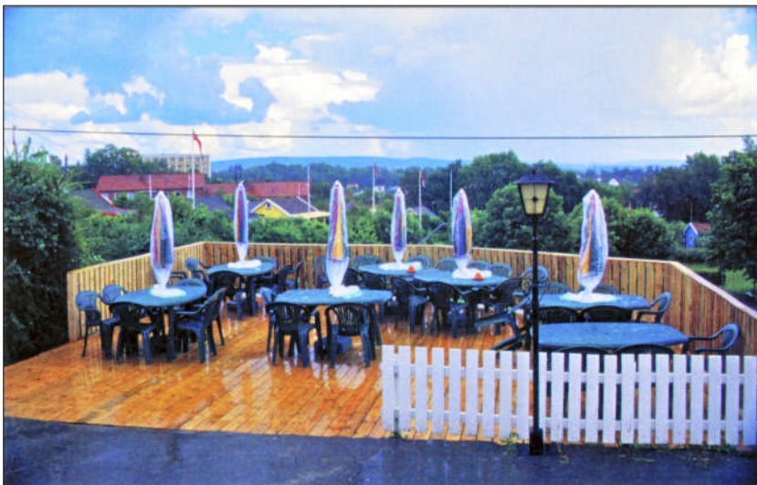
Solpynten, ferdig nylakkert og klar til å ta imot sine første gjester!

Utgitt av styret på Solvang Kolonihager, avdeling 1