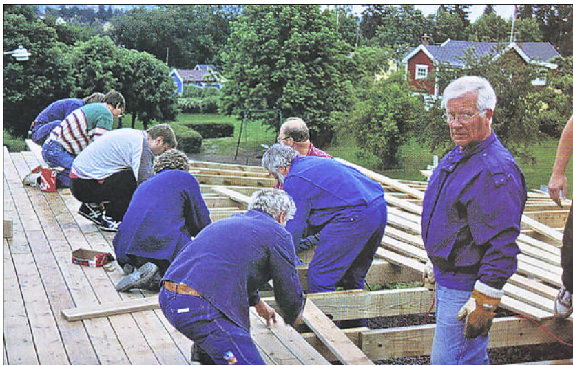
En driftig gjeng under arbeidet med Solpynten 1997

I høysesongen, når det er fint vær, serverer Damelaget vafler, kaffe og mineralvann hver søndag.