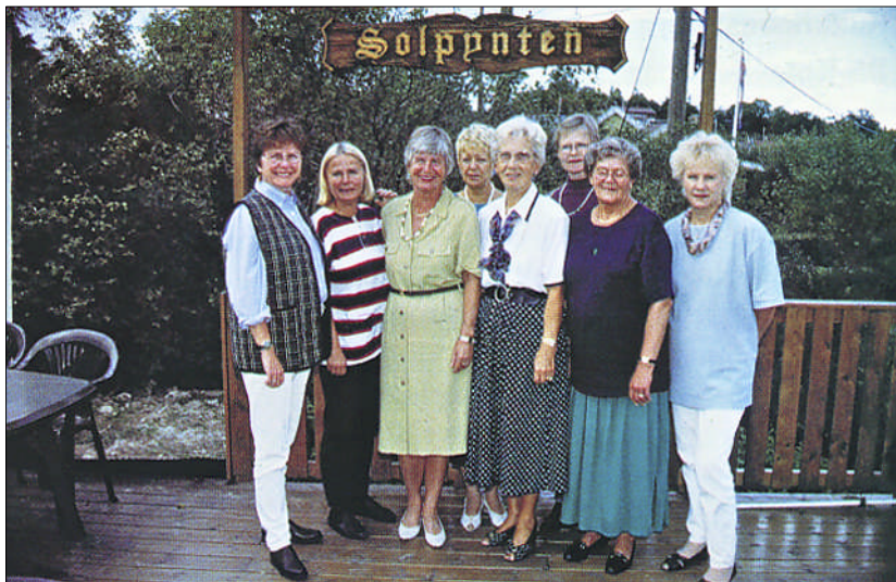
Damelagets styre i jubileumsåret.

I 1986 endret Kvinneforeningen navn til Damelaget. Årsaken til navneendringen var at de fleste syntes at Kvinneforeningen hørtes tungt og gammeldags ut i forhold til Gubbelaget.