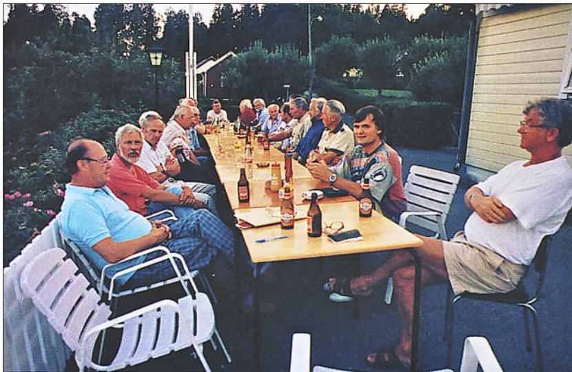
Gubbelagsmøte i fint vær utenfor Huset