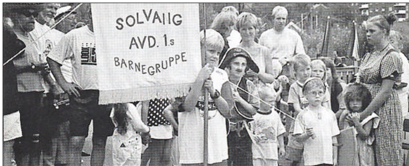
Barnas dag 1997

Barnas dag ble for første gang arrangert i 1948. Dette har blitt en kjær tradisjon hvor voksne sammen med barn og barnebarn samles til kostymeopptog, leker, underholdning, konkurranser, servering etc. Det var vanlig at en hest med blomsterpyntet kjerre fra Gaustad gård ledet an i opptoget sammen med en musikanter. Som regel arrangeres Barnas dag på en søndag like før skolestart.