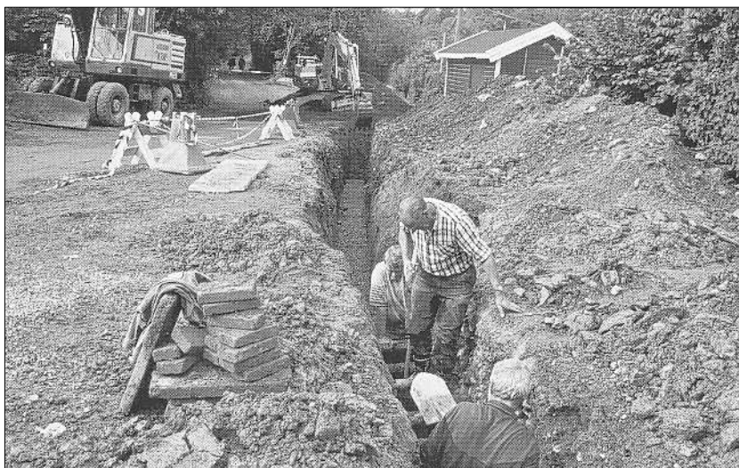
Vann- og avløp legges inn i hagen